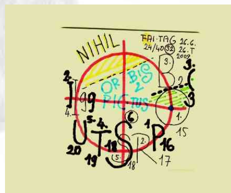
Zdeněk Košek (OR)